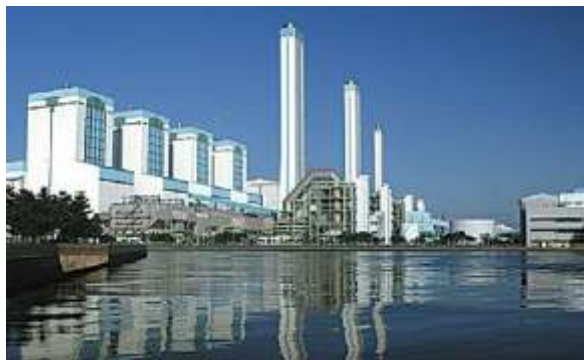
System odsiarczania spalin metodą mokrą w Elektrowni Tangjin w Korei

Firma Lodge Cottrell oferuje technologię odsiarczania spalin przewidzianą do zastosowań w dużych obiektach przemysłowych takich jak elektrownie, huty i fabryki produktów chemicznych. Ten wysokowydajny i niskokosztowy proces, w trakcie którego wapień zostaje przekształcony w gips, jest bardzo dobrze sprawdzony i stosowany w dużej liczbie kotłów energetycznych na całym świecie.