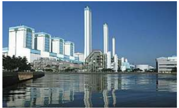
System odsiarczania spalin metodą mokrą w Elektrowni Tangjin w Korei

Firma Lodge Cottrell oferuje technologię odsiarczania spalin przewidzianą do zastosowań w dużych obiektach przemysłowych takich jak elektrownie, huty i fabryki produktów chemicznych. Ten wysokowydajny i niskokosztowy proces, w trakcie którego wapień zostaje przekształcony w gips, jest bardzo dobrze sprawdzony i stosowany w dużej liczbie kotłów energetycznych na całym świecie.